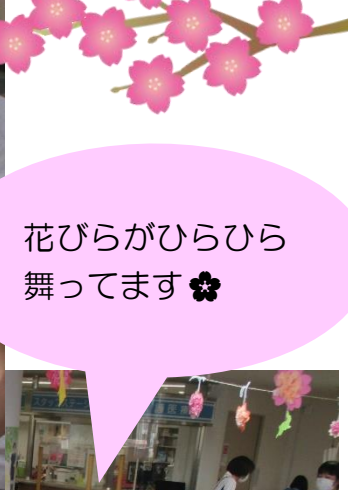
花びらがひらひら舞ってます❀